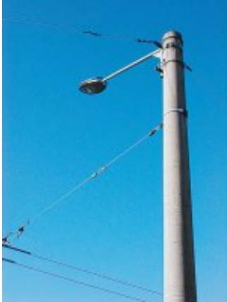
Eine neue, ökologisch günstige Straßenlaterne beim Uni-Park: Der Lichtkegel leuchtet nur nach unten.

Der „Lichtverbrauch“ der österreichischen Landeshauptstädte ist sehr unterschiedlich. Die Stadt Salzburg wendet doppelt soviel Energie (16 Watt pro Kopf) für die öffentliche Beleuchtung auf wie Graz und Wien, die mit rund acht Watt „Anschlussleistung“ auskommen. Astronom Posch: „Salzburg verbraucht rund 10 Gigawattstunden für die öffentliche Beleuchtung, das sind umgerechnet pro Jahr 1,5 Mio. Euro“ (bei kalkulierten Kosten von 15 Cent pro Kilowattstunde).