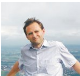
Astronom Thomas Posch: „Man könnte die Hälfte der öffentlichen Beleuchtung abdrehen.“

In Europa entweicht Streulicht um jährlich 1,7 Milliarden Euro. Rund 30 Prozent des Lichts im öffentlichen Raum wird vergeudet, weil es nach oben abstrahlt. Die Lichtverschmutzung schädigt Mensch und Tier und verunreinigt die natürliche Dunkelheit.